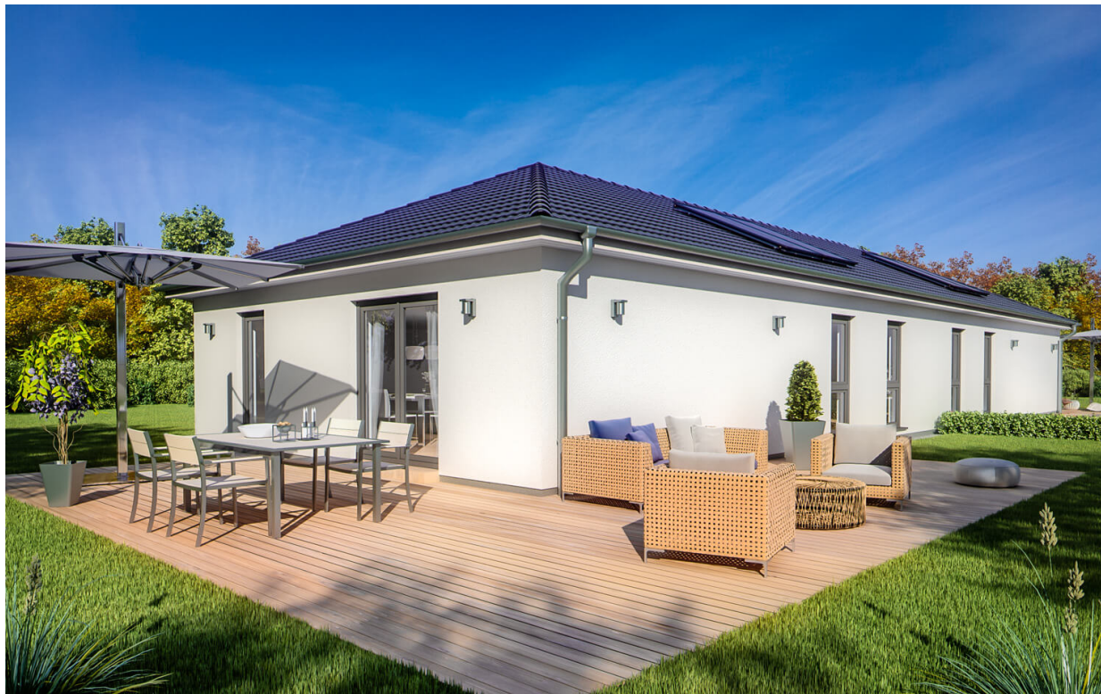
Doppelhaus SH 83 B DHH

Abbildungen können Sonderausstattungen enthalten