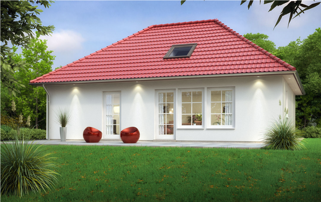
Bungalow: SH 80 B plus 40

Abbildungen können Sonderausstattungen enthalten