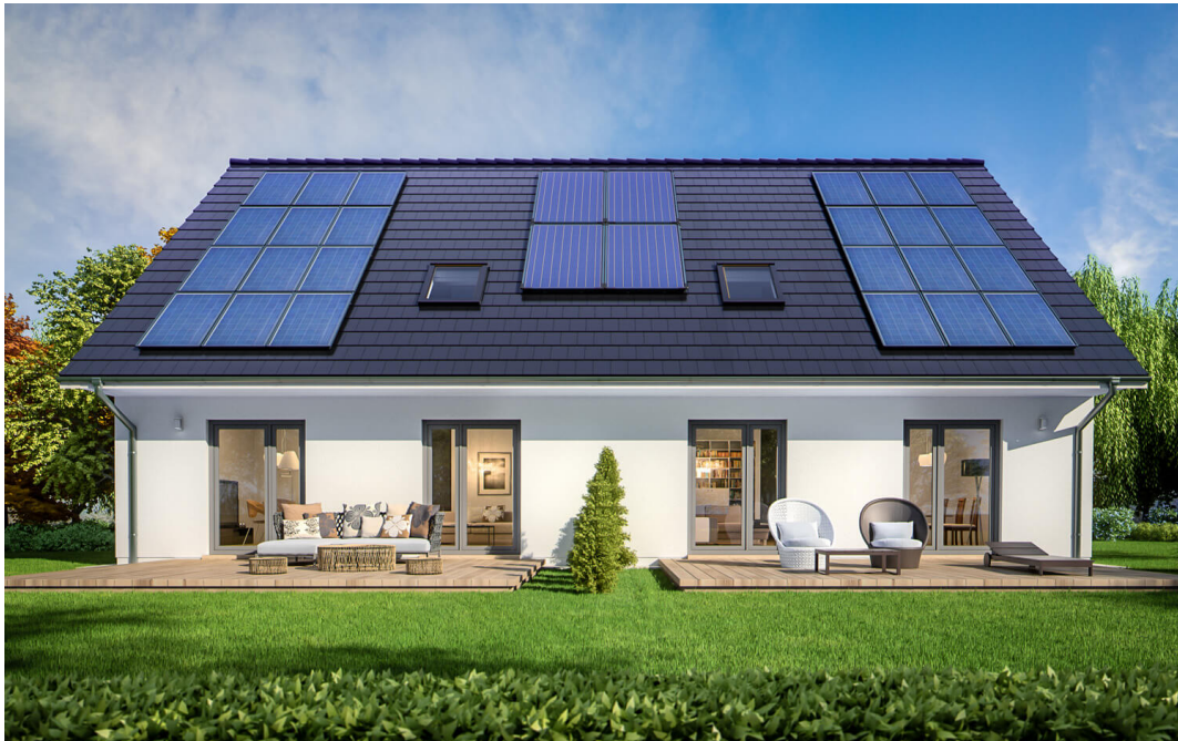
Fertighaus Mehrgenerationenhaus 1,5-Geschosser SH 244 EW

Abbildungen können Sonderausstattungen enthalten