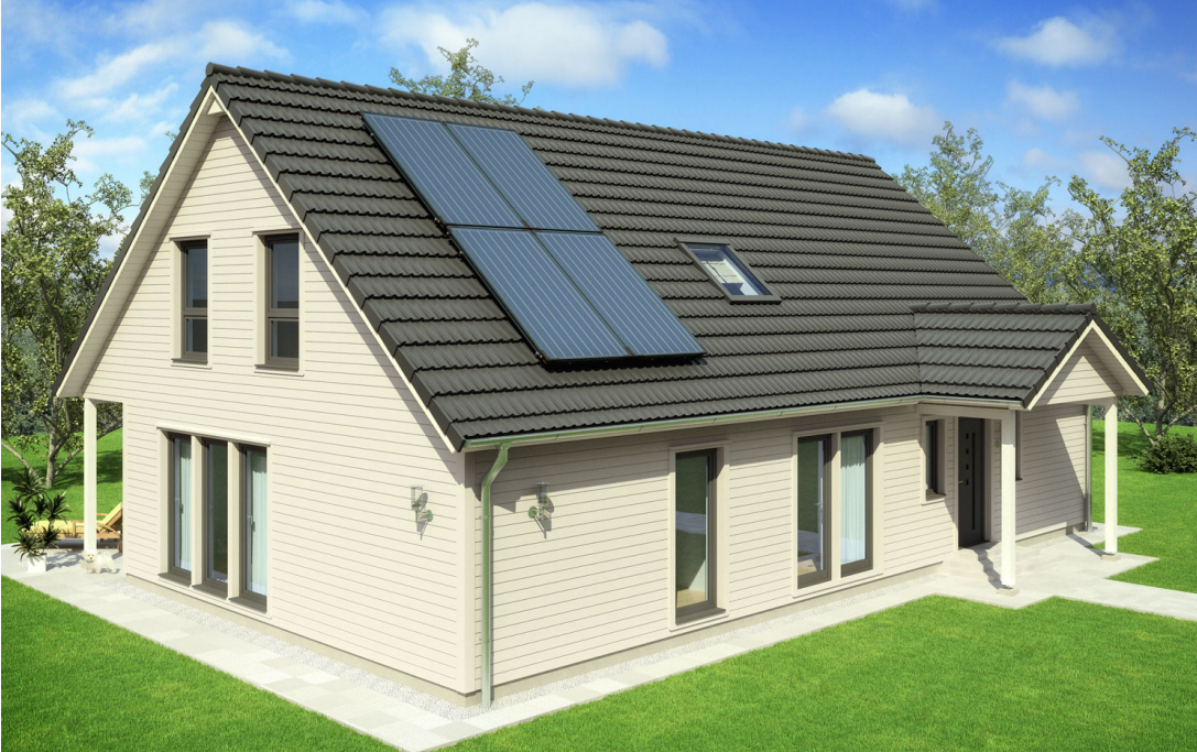
1,5 Geschosser: SH 219

Abbildungen können Sonderausstattungen enthalten