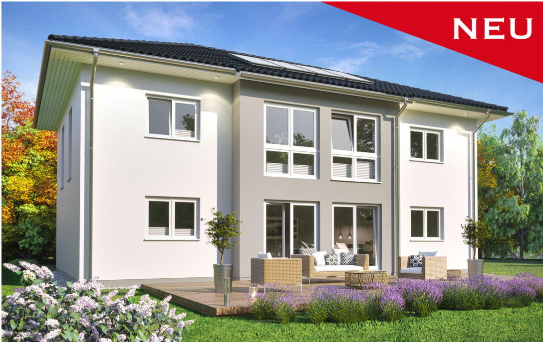
Generationenhaus: SH 202 S EW

Abbildungen können Sonderausstattungen enthalten