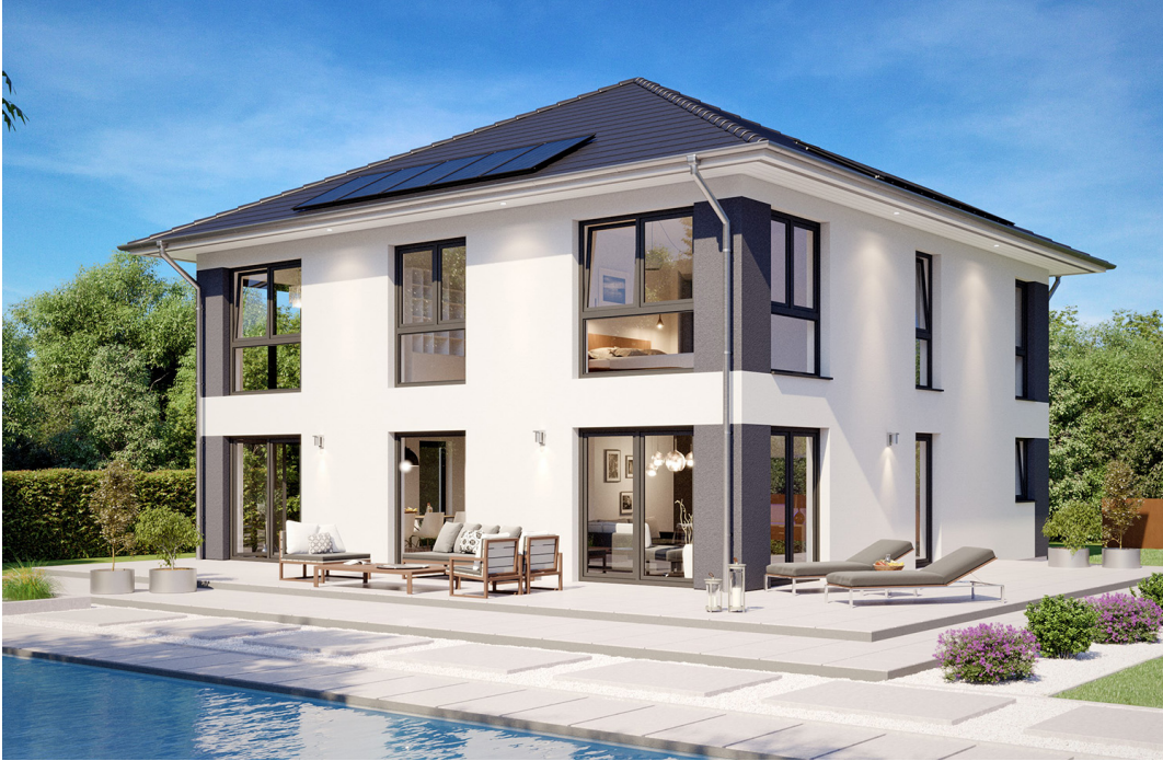
Stadtvilla SH 200 S

Abbildungen können Sonderausstattungen enthalten