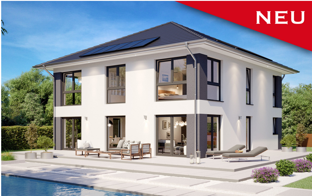
Fertighaus Stadtvilla SH 200 S

Abbildungen können Sonderausstattungen enthalten