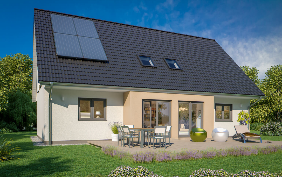
Generationenhaus: SH 195 EW

Abbildungen können Sonderausstattungen enthalten