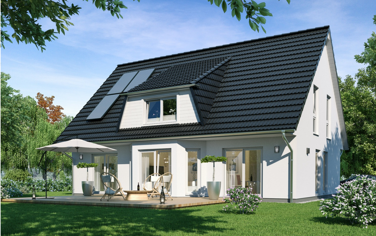
1,5-Geschosser: SH 180 - VAR. D

Abbildungen können Sonderausstattungen enthalten