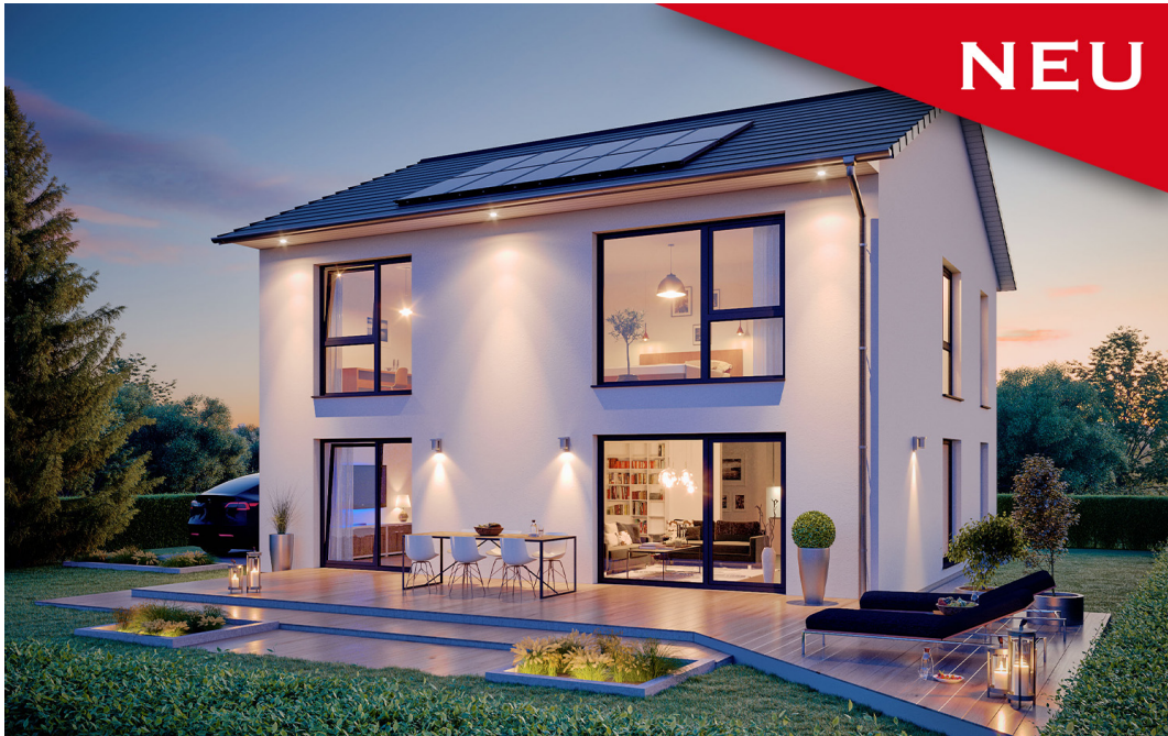
Stadtvilla SH 172 S

https://www.scanhaus.de/fertighaeuser/stadtvillen/sh-172-s