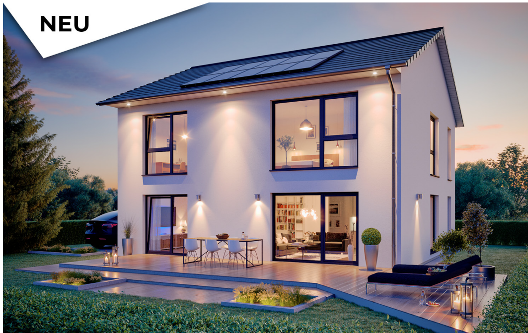
Fertighaus Stadtvilla SH 172 S mit Panoramaverglasung (inklusive)

Abbildungen können Sonderausstattungen enthalten