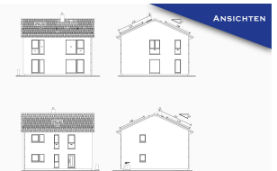
Ansichten Stadtvilla SH 172 S