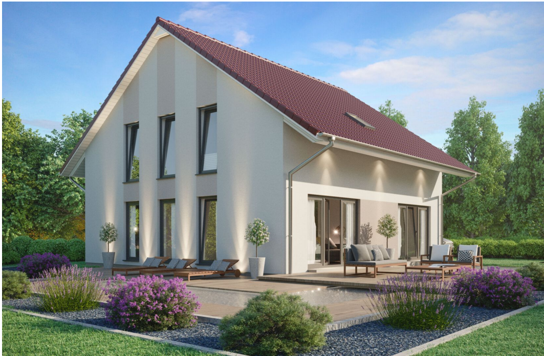
Fertighaus 1,5-Geschosser SH 165 Drempel

Abbildungen können Sonderausstattungen enthalten