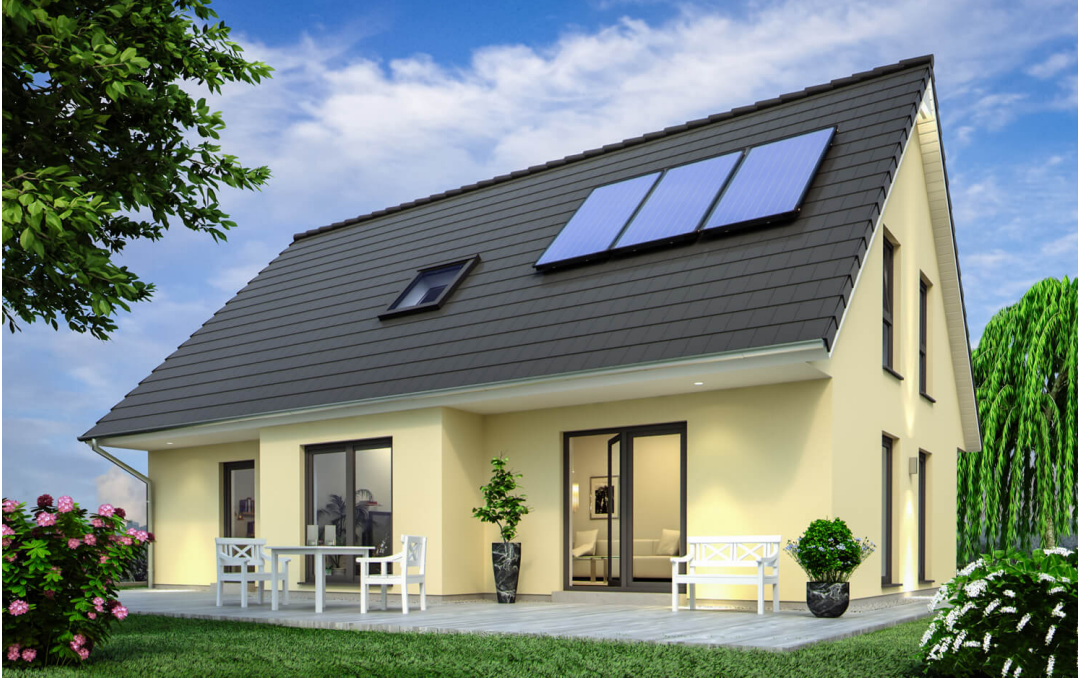
1,5-Geschosser: SH 160 XXL

https://scanhaus.de/fertighaeuser/15-geschosser/sh-160-xxl