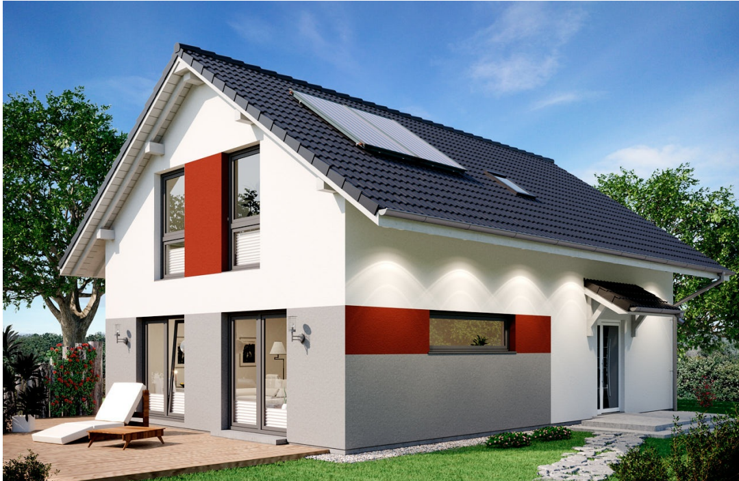
1,5-Geschosser: SH 142 D

https://scanhaus.de/fertighaeuser/15-geschosser/sh-142-d