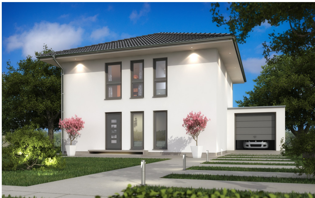
Fertighaus Stadtvilla SH 135 S mit Garage

https://www.scanhaus.de/fertighaeuser/stadtvillen/sh-135-s