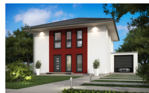
Fertighaus Stadtvilla SH 135 S