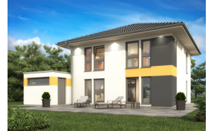
Stadtvilla: SH 135 S | mit Absteller