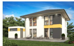
Fertighaus Stadtvilla SH 135 S mit Absteller