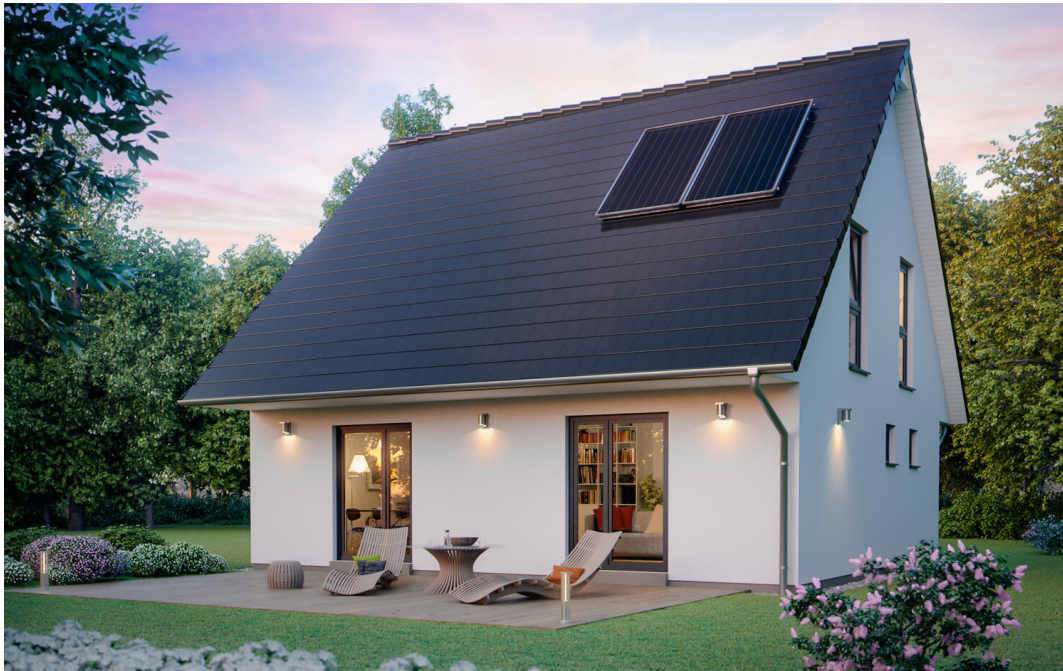
Fertighaus 1,5-Geschosser SH 122 - Var. E

https://www.scanhaus.de/fertighaeuser/15-geschosser/sh-122-variante-e