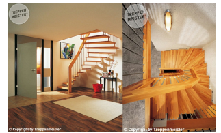
Beispiel Freitragende Systemtreppe