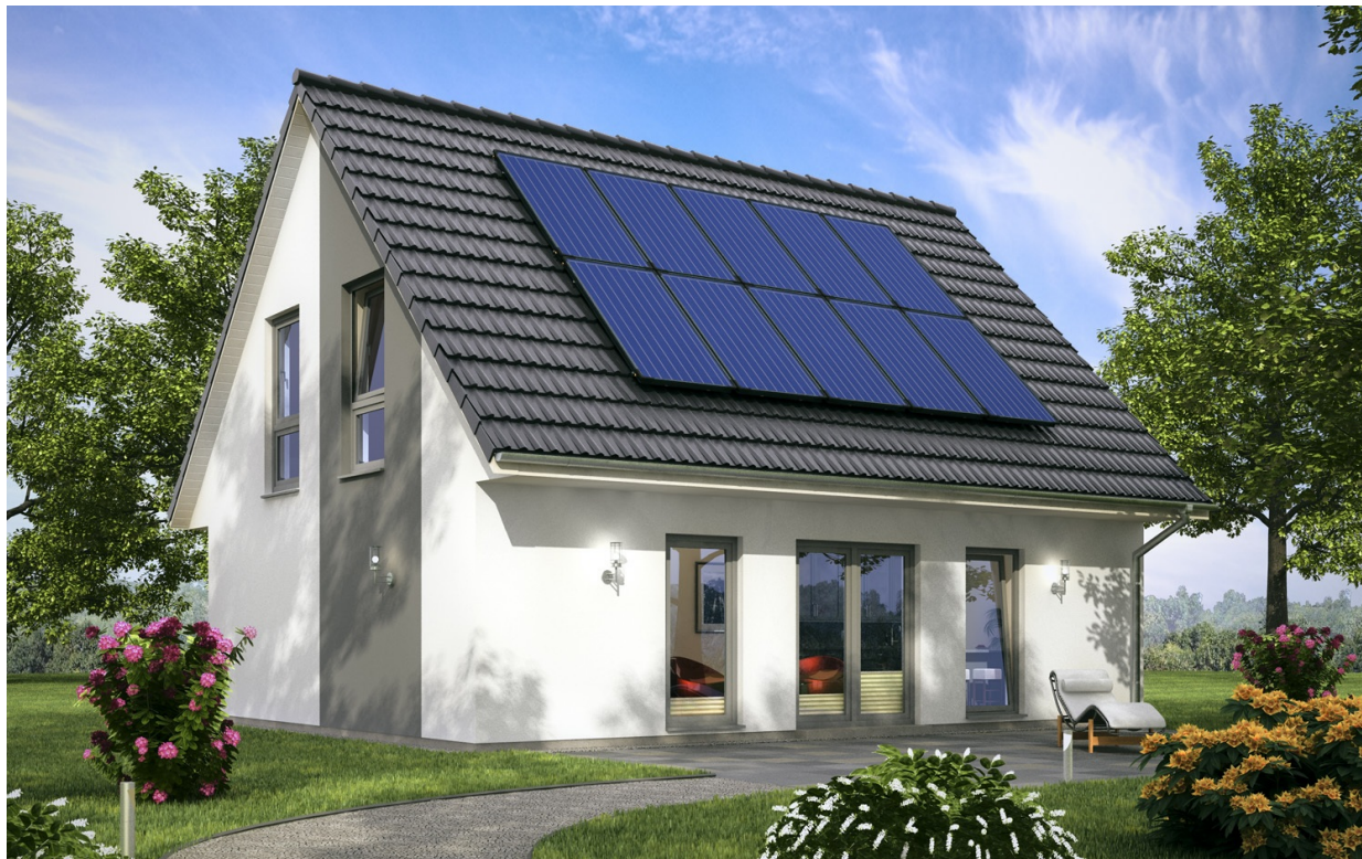
1,5-Geschosser: SH 122 - VAR. A3

Abbildungen können Sonderausstattungen enthalten