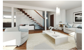
Fertighaus 1,5-Geschosser SH 122 - Var. D Wohn- und Essbereich