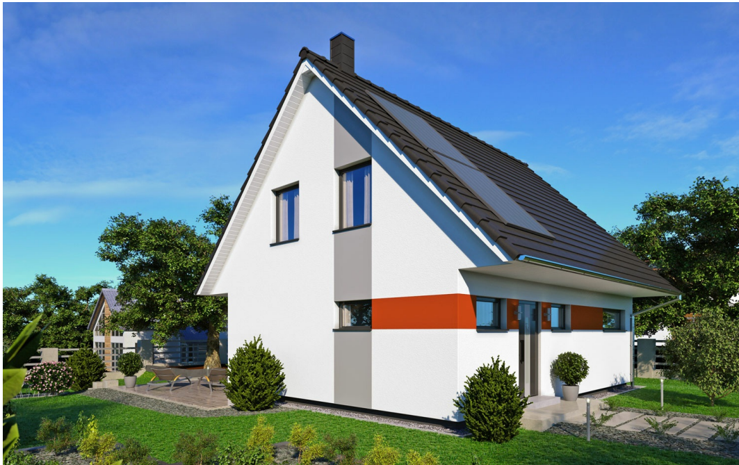
Fertighaus 1,5-Geschosser SH 122 - Var. D

https://www.scanhaus.de/fertighaeuser/15-geschosser/sh-122-var-d