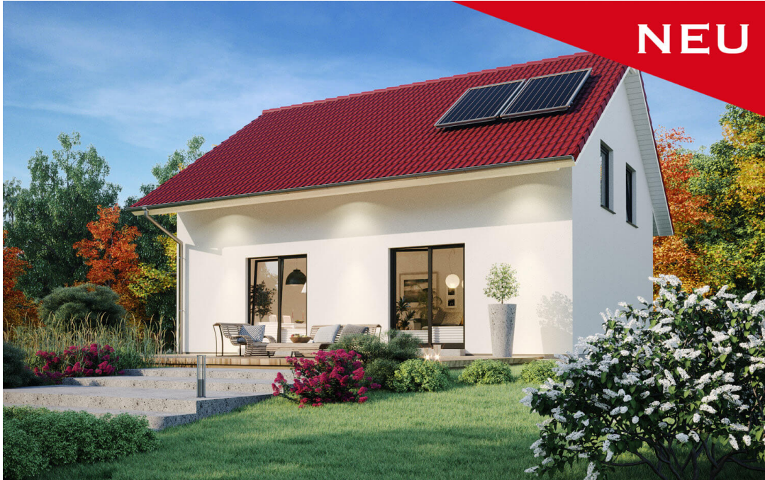
1,5-Geschosser: SH 122 D - VAR. A1

https://scanhaus.de/fertighaeuser/15-geschosser/sh-122-d