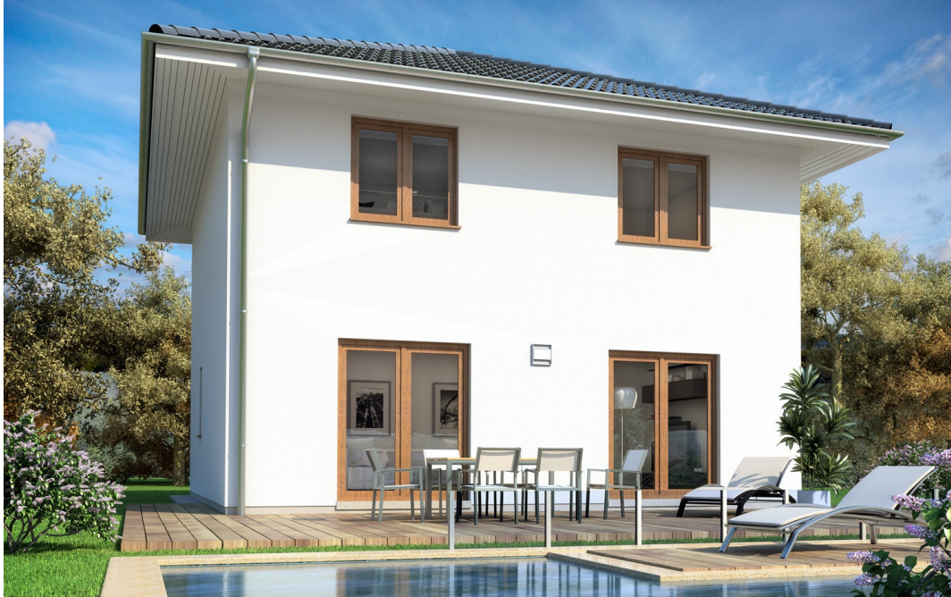
Fertighaus Stadtvilla SH 114 S - Var. A

https://www.scanhaus.de/fertighaeuser/stadtvillen/sh-114-s-variante-a