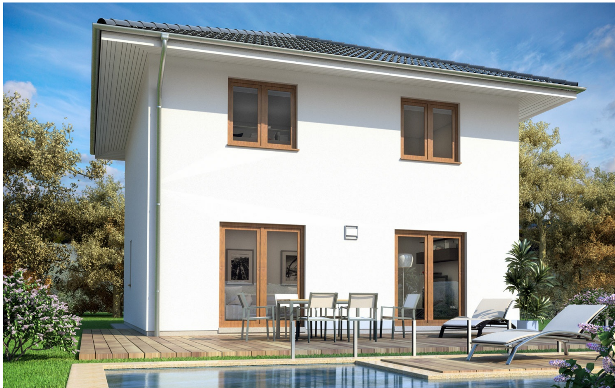
SH 114 S - VAR. A

Abbildungen können Sonderausstattungen enthalten