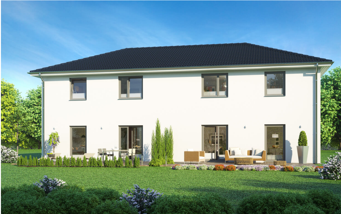
Doppelhaus SH 114 S DHH

Abbildungen können Sonderausstattungen enthalten