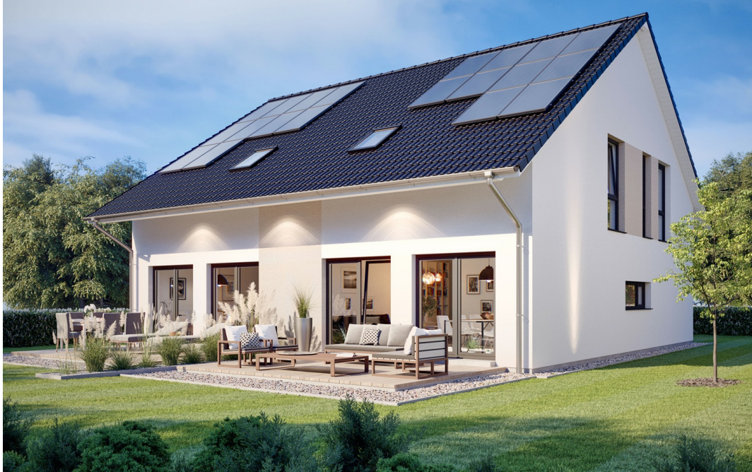
Doppelhaus SH 106 Drempel DHH

Abbildungen können Sonderausstattungen enthalten