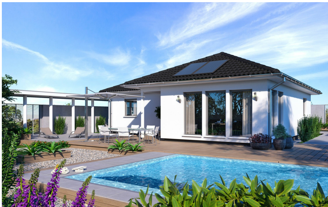
Bungalow: SH 105 WB

https://www.scanhaus.de/fertighaeuser/bungalows/sh-105-wb