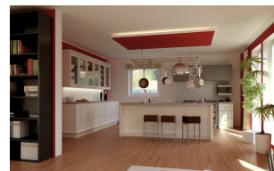
Bungalow: SH 105 WB Innenansicht