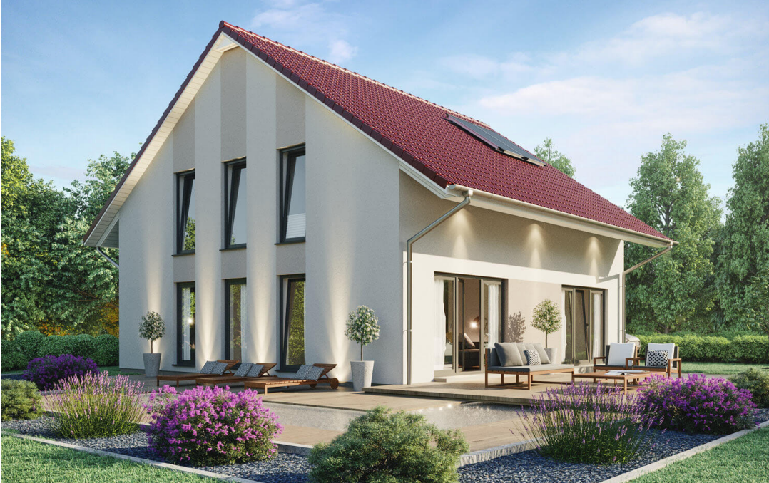
1,5-Geschosser: SH 165 D

https://scanhaus.de/fertighaeuser/15-geschosser/id-15-geschosser-sh-165-d