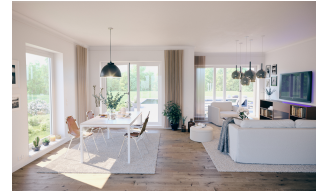
1,5 Geschosser: SH 150 FS Wohn- und Essbereich