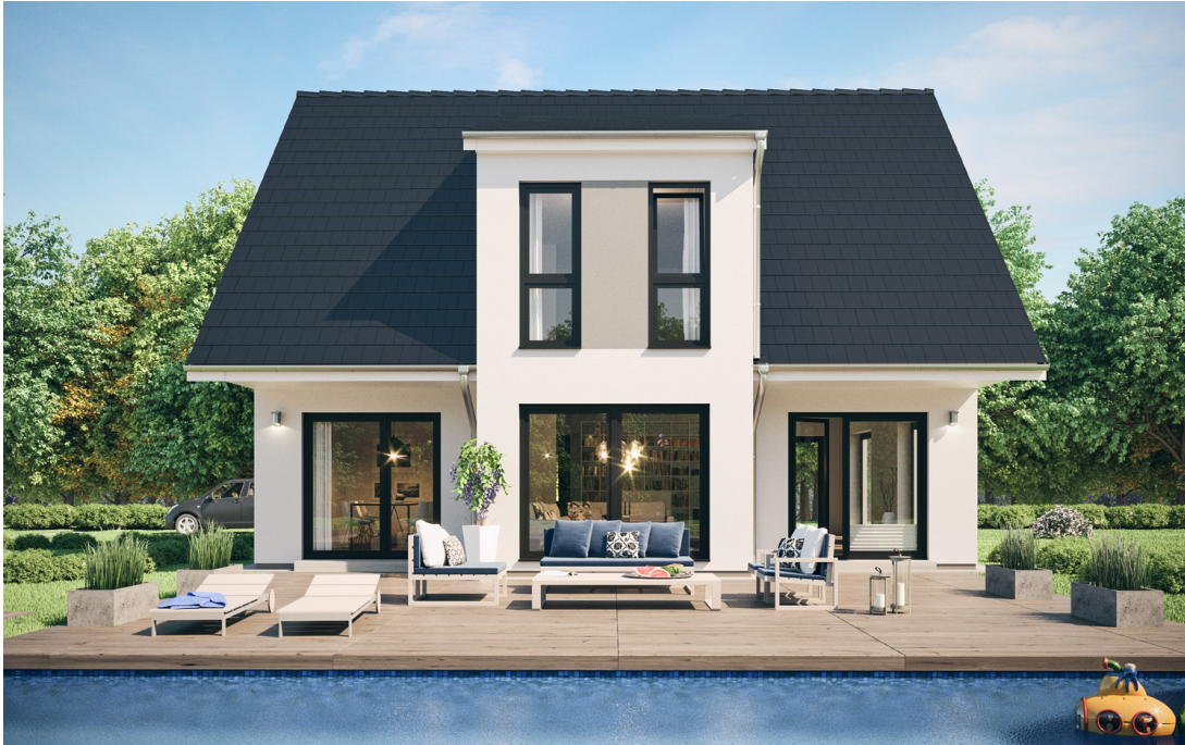
1,5 Geschosser: SH 150 FS

https://scanhaus.de/fertighaeuser/15-geschosser/id-15-geschosser-sh-150-fs