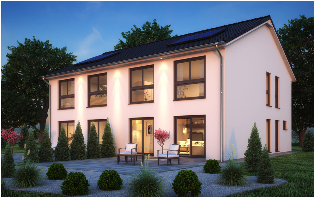
Fertighaus Doppelhaus Stadtvilla SH 127 S DHH

https://www.scanhaus.de/fertighaeuser/doppelhaeuser/doppelhaus-sh-127-s-dhh