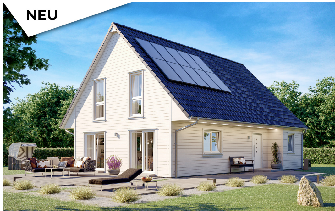
Mehrgenerationenhaus 1,5-Geschosser SH 142 XXL EW

https://www.scanhaus.de/fertighaeuser/mehrgenerationenhaeuser/SH-142-XXL-EW-Variante-B